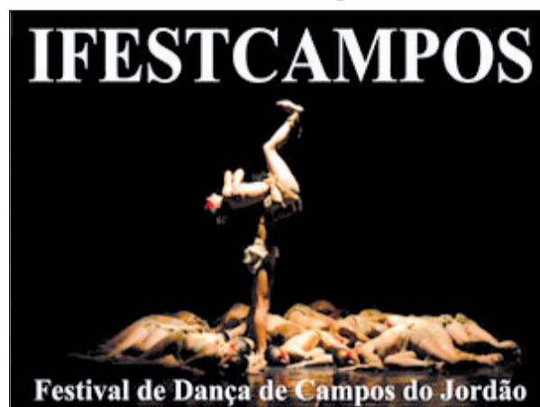
Festival de Dança de Campos do Jordão