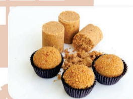
BRIGADEIRO DE PAÇOCA