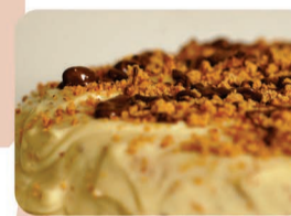
BOLO ALPINO DE PAÇOCA

AV. MINISTRO NÉLSON HUNGRIA, 426 - SANTO ANTONIO DO PINHAL - SP (12) 3666-1267 - WWW.MATINALDOCERIA.COM.BR - WWW.FB.COM/MATINALDOCERIA