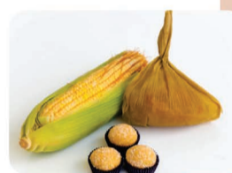
BRIGADEIRO DE PAMONHA

A melhor doceria da região com os mais deliciosos quitutes para seu Arraiá nas montanhas!