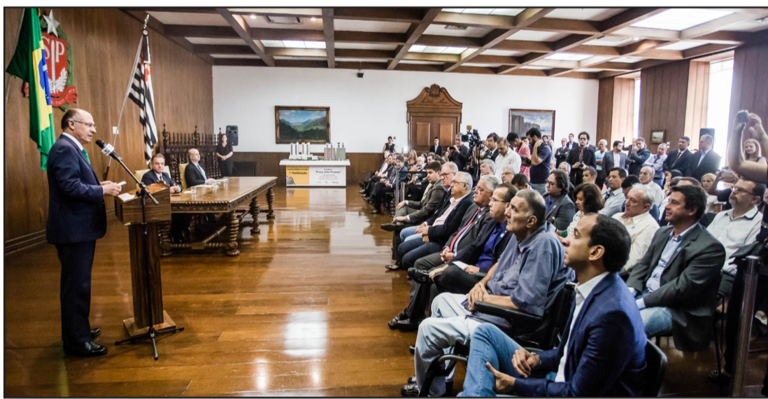
Convênios assinados nesta terça-feira (27/12):