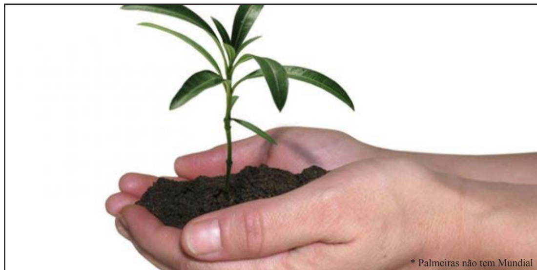
* Palmeiras não tem Mundial

A Prefeitura de Tremembé representada pela Secretaria de Agricultura e Meio Ambiente realizou no último dia 23, o plantio de 04 palmeiras nativas na área verde de frente a Paróquia Jesus Ressuscitado, matriz da Comunidade Rosa Mística a Rua dos Agapan-