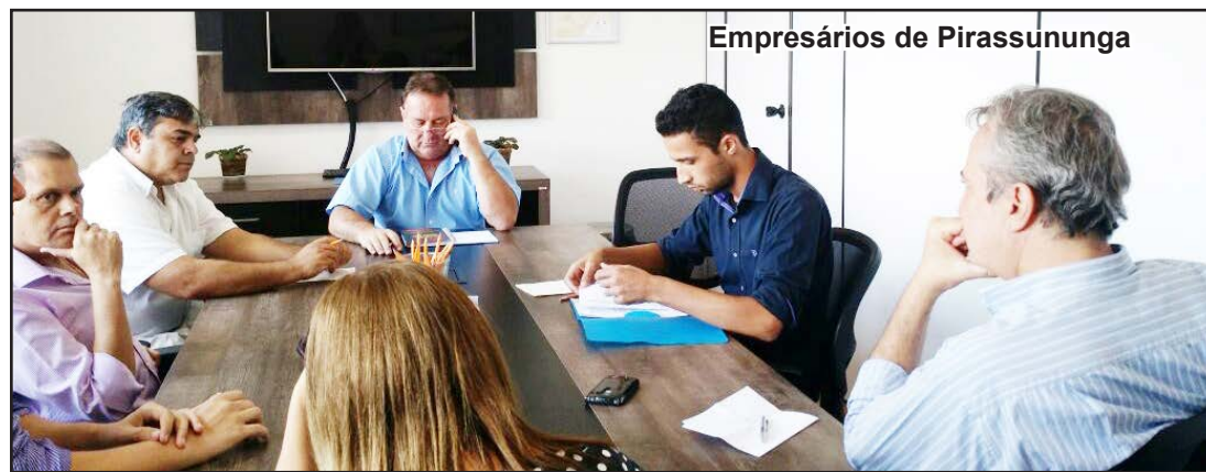
Empresários de Pirassununga