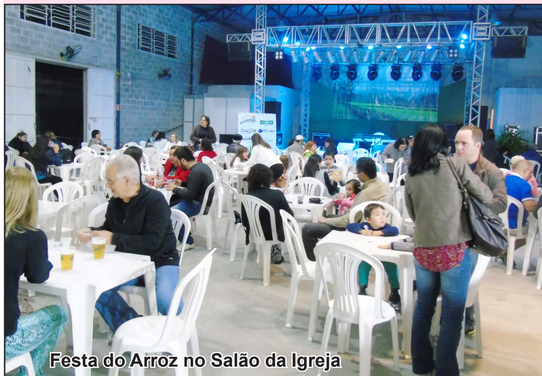
Festa do Arroz no Salão da Igreja

A Festa do Arroz de Tremembé entrou na sua nona edição, mas inconformados com o sucesso dos idealizadores da festa, outro grupo resolveu plagiar e copiar a original.