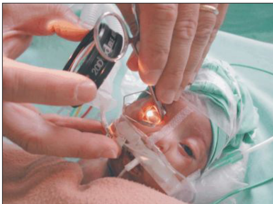
Foto de celular pode prevenir cegueira infantil