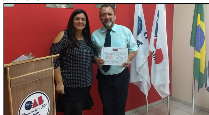
Comissão de Defesa da Cidadania