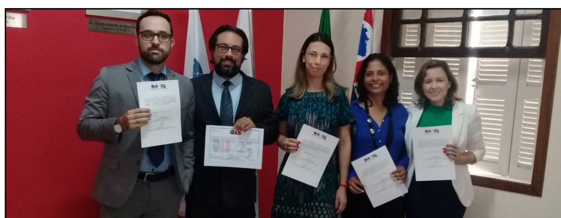
Comissão de Assistência Judiciária