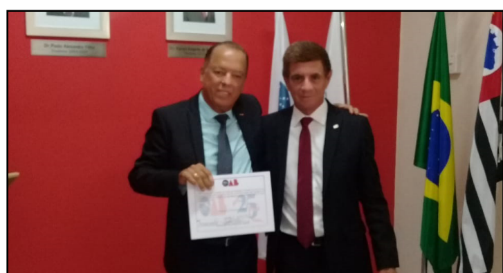
Comissão de Ética e Disciplina