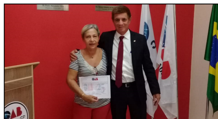
Comissão de Direitos Humanos