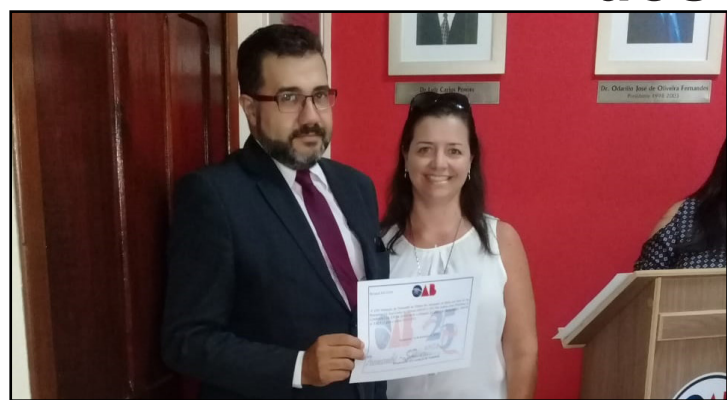
Comissão da Jovem Advocacia