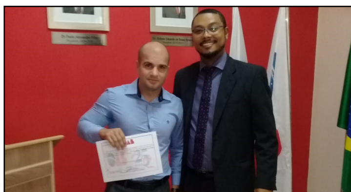
Comissão de Direito Desportivo