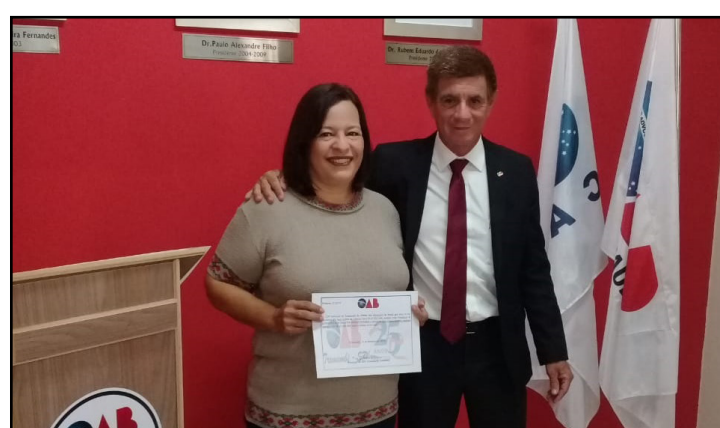
Comissão dos Direitos Infantojuvenis

A OAB de Tremembé realizou no dia 14 de fevereiro a nomeação dos Presidentes das comissões que atuarão nesta gestão 2019/2021.