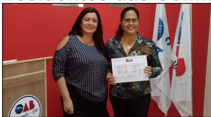
Comissão da Mulher Advogada