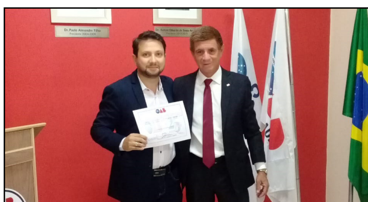
Comissão de Segurança Pública