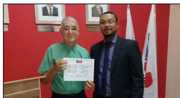
Comissão do Advogado Idoso