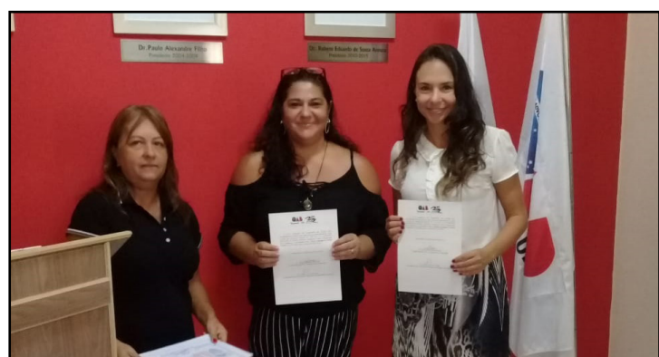
Comissão de Defesa dos Animais