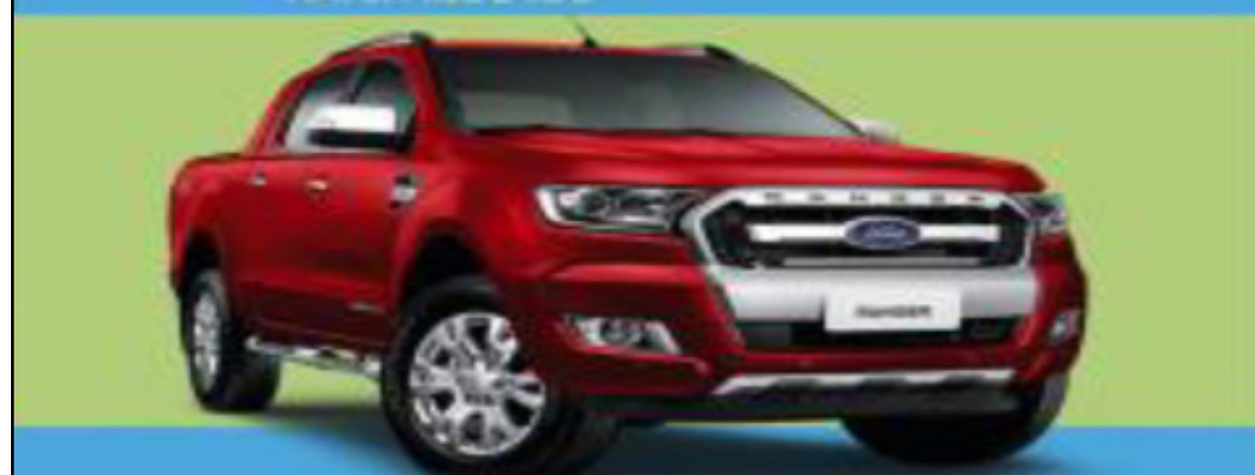
RANGER 2.2 L DIESEL