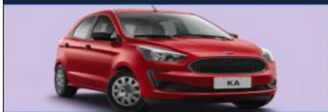
NOVO KA HATCH 1.0L E 1.5L