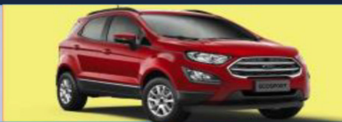
ECOSPORT 1.5L / 1.6L E 2.0L