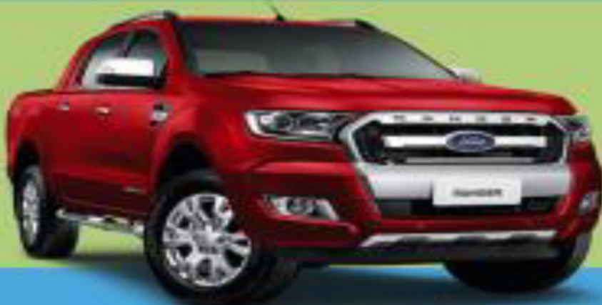
RANGER 2.2L DIESEL