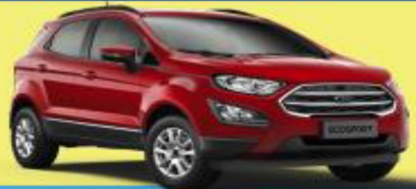
ECOSPORT 1.5L / 1.6L E 2.0L