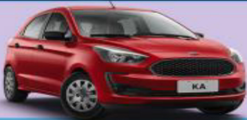
NOVO KA HATCH 1.0 LE 1.5L