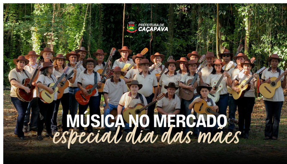
MÚSICA NO MERCADO edição especial dia das mães

A Prefeitura de Caçapava, realiza neste sábado, 10 de maio, uma edição especial do projeto “Música no Mercado” em homenagem ao Dia das Mães. A apresentação será realizada a partir das 9h, no Mercado Municipal, com participação da Orquestra